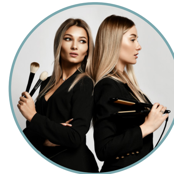
HairStylist Senior Hair Stylist